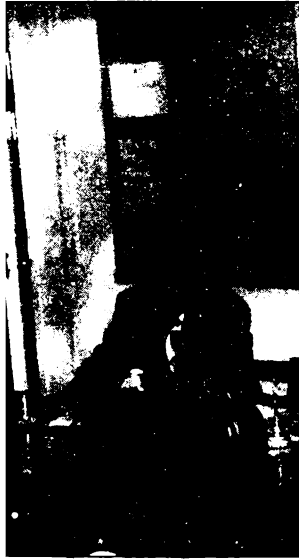
مراقي بمناسبة العيد الستيني.